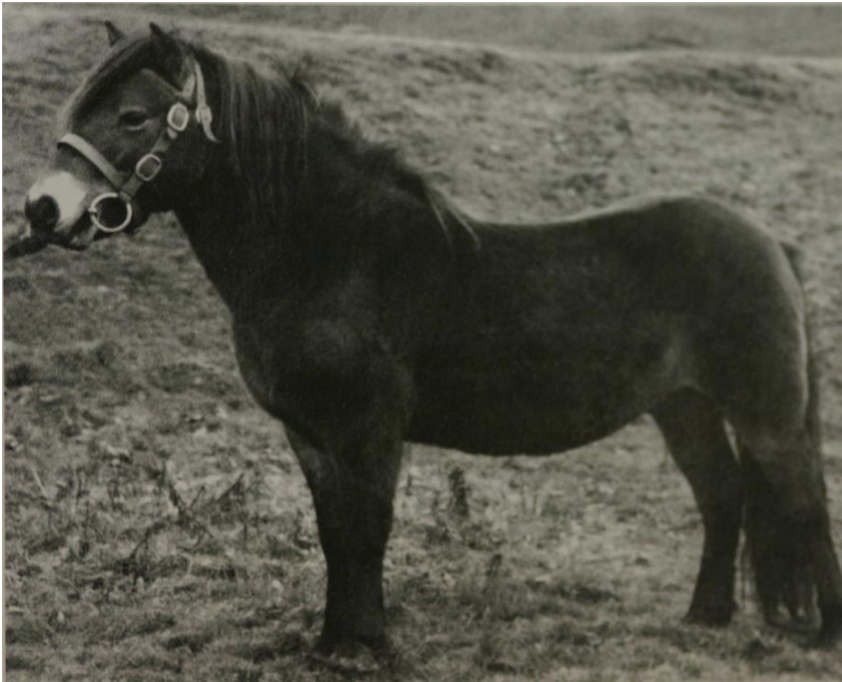
Stamvader Tommy (12/19) van de 1A sub-bloedlijn

Om op de lange termijn inteelt te voorkomen, stellen wij voor dat in het stamboek achter elk dier wordt vermeld van welke hengstenlijn deze is. Ook is het belangrijk voldoende hengsten van elke hengstenlijn te importeren en te behouden. Dat kan door bijvoorbeeld ze in een hengstengroepen te houden. Bij vrijlevende paarden is een hengstengroep, net als een haremgroep, een natuurlijk verschijnsel.