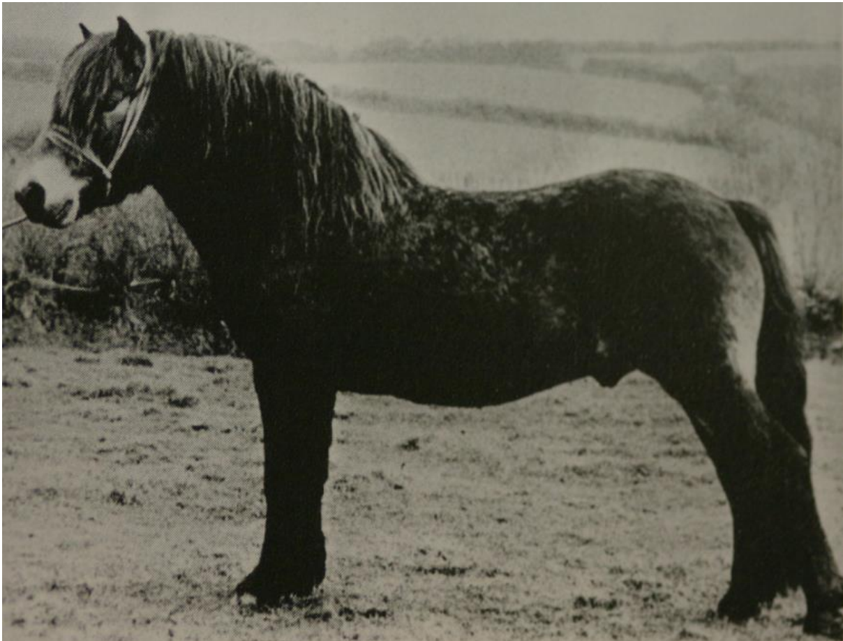
De hengst Caractacus (1/9) werd geboren in 1935 en is een zoon van stamvader 12/13 (de foto is overgenomen uit het boek Exmoorponies, survival of the fittest van Sue Baker, 2008)

In ons samenwerkings-verband is vrijwel elke kudde merries van de 2- of 3-lijn. In het beste geval wisselt men die af met de 2- en 3-lijnen, maar in veel gevallen volgt op een 2B hengst (Ilkerton Cracker) een 2C hengst (Apollo) enz. Ik doe hier zelf (in België) duchtig aan mee en heb zelfs speciaal in Duitsland een 2B hengst (zoon van Little Lord) gekocht om een merrie van de 2B lijn te laten dekken, niet echt slim dus. Ik besluit hieruit dat we dus wel de luxe hebben van voldoende hengsten (behalve dan van de 1-lijn), maar dat die hengsten misschien niet allemaal bij de juiste kudde lopen. Op korte termijn is er dus een tekort aan hengsten van de 1A-lijn en 1B-lijn.