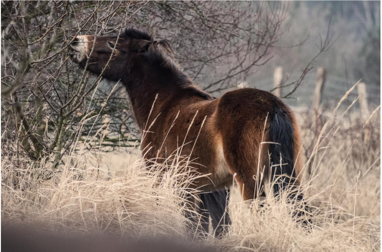
Eén van de vrijgelaten Exmoors

In de nieuwsbrief van december 2014 maakten we al melding van de plannen van European Wildlife, om dit voorjaar een groep Exmoorpony's vrij te laten op het voormalig militair terrein Milovice (op circa 40 km van Praag). Op 28 januari werd er een groep van 14 Exmoorpony's losgelaten, en deze redden zich uitstekend (zie onderstaande foto). Op de website van European Wildlife noemt directeur Dalibor Dostal de terugkeer van de wilde oerpony één van de belangrijkste gebeurtenissen op het gebied van natuurbescherming in Centraal Europa. Wie dit zelf wil lezen en meer foto's van het vrijlaten wil zien kan dat op: http://www.eurowildlife.org/news/historical-event-wild-horses-are-returning-to-central-europe-after-centuries/