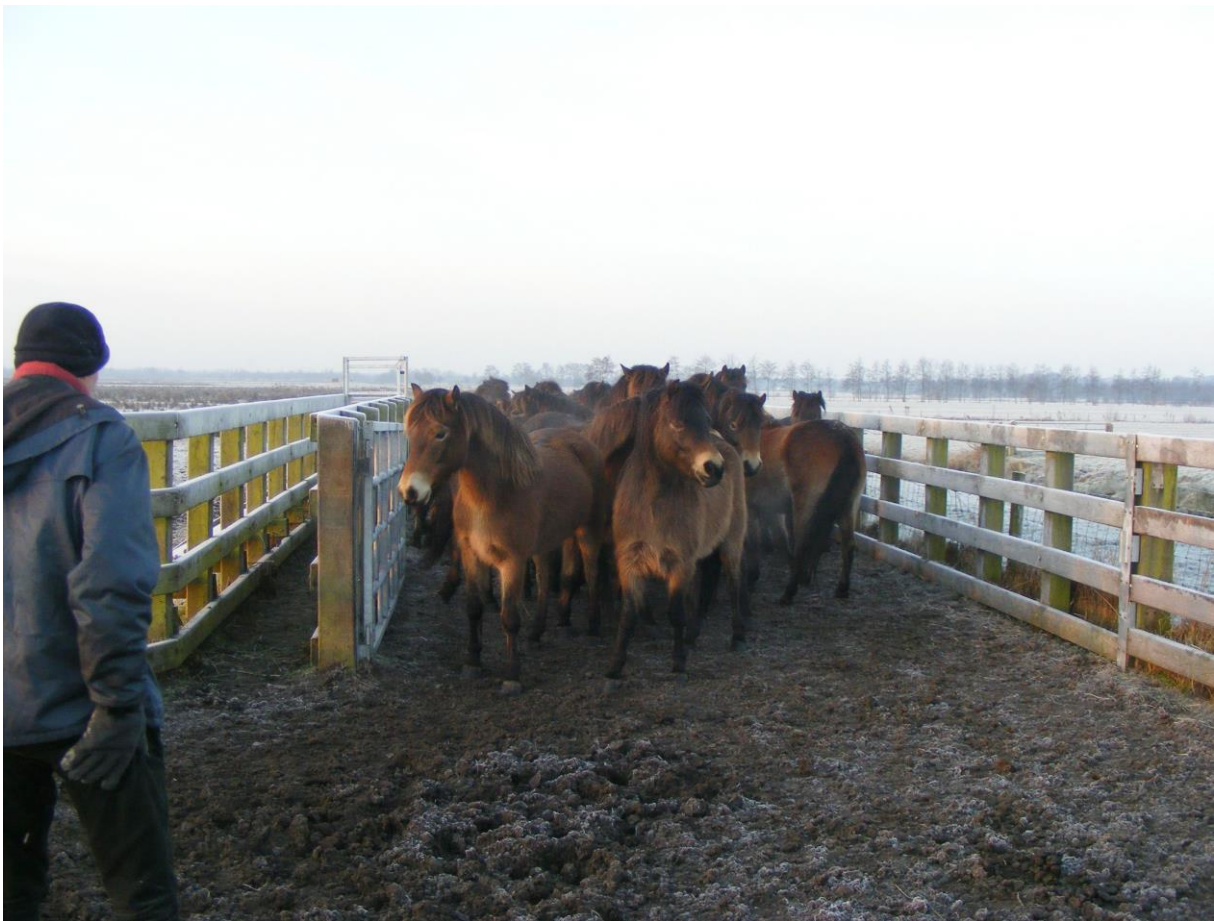
Eva Koning fotografeerde deze Exmoorpony's met Jaap Mekel in de vangkraal